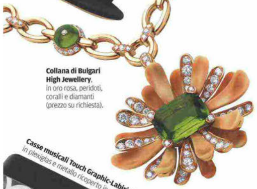
Collana di Bulgari High Jewellery. in oro rosa, peridot, coralli e diamanti (prezzo su richiesta).