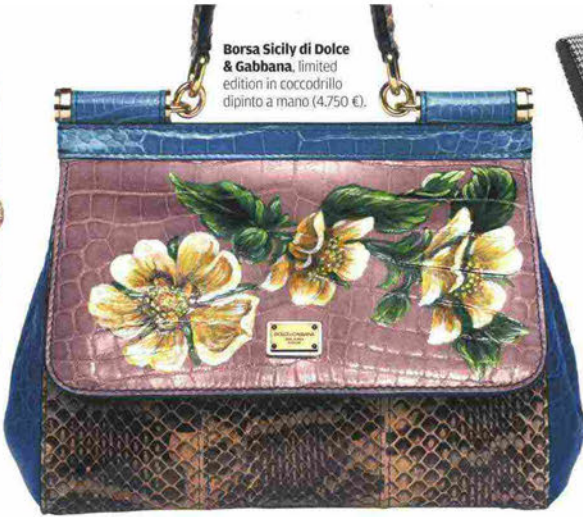
Borsa Sicily di Dolce & Gabbana. limited edition in cocodrillo dipinto a mano (4.750 €).