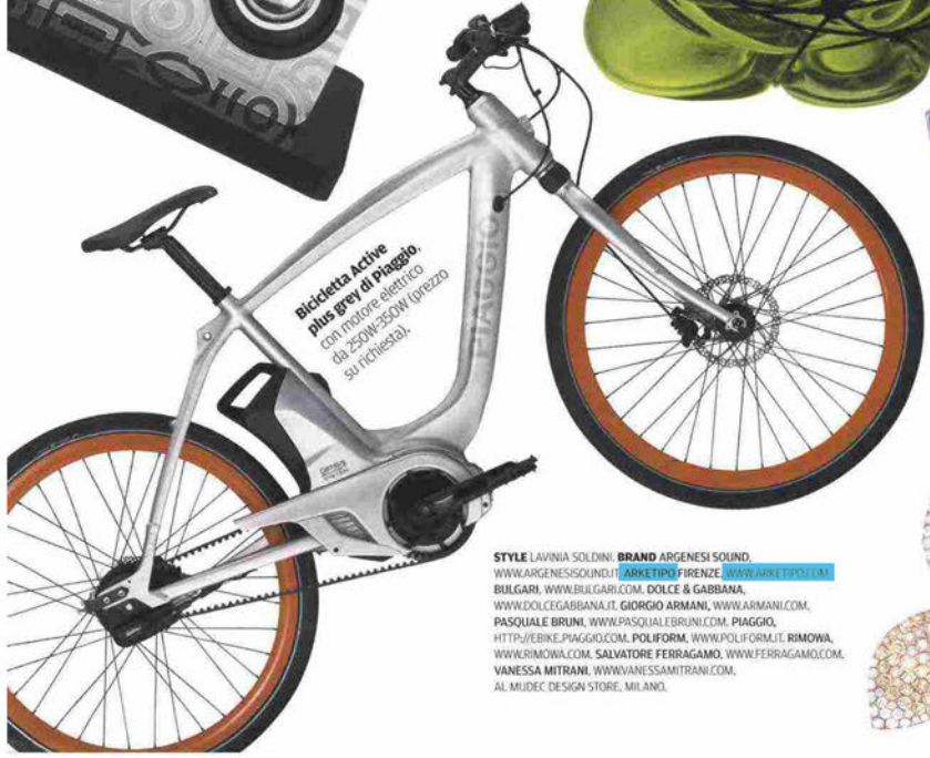
Ricicletta Active plus grey di Piaggio. con motore elettrico da 250W-300W (prezzo su richiesta).