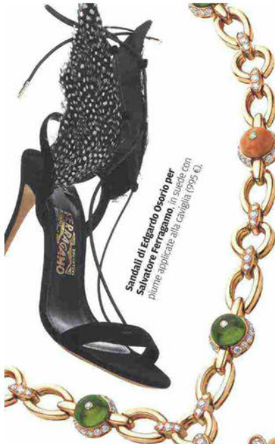
Sandali di Edgardo Osorio per Salvatore Ferragamo. In suede con piume applicate alla caviglia (995 €).