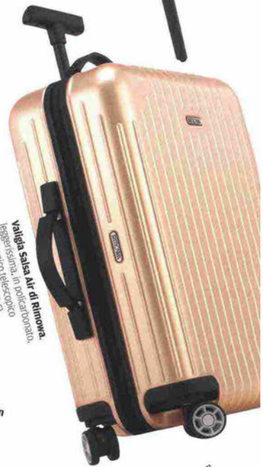
Valigia salsa Air di Rimowa. leggerissima, in polycarbonato, con manico telescopico (con optional da 459 €).