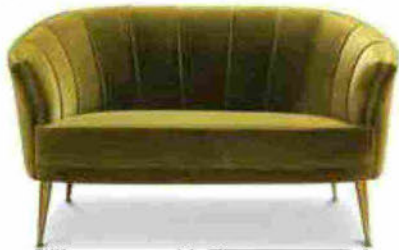
Sofa Maya, Brabbu