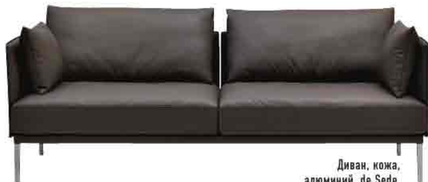
Диван, кожа, алюминий, de Sede.