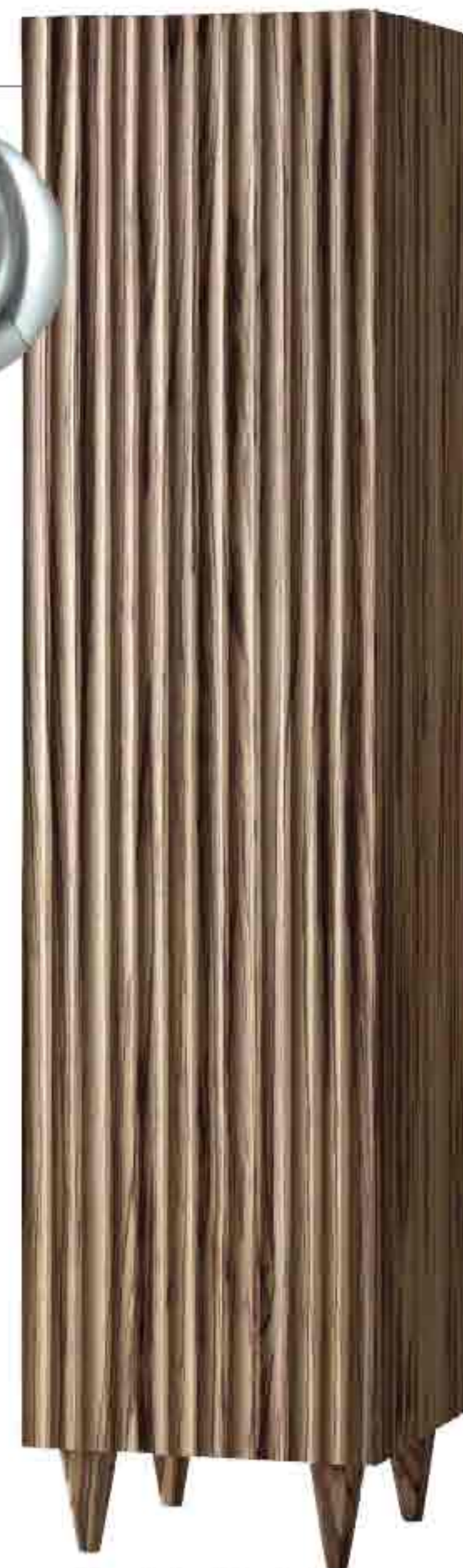
Morelato. Шкаф Janus из коллекции Giano с фирменной гофрированной дверцей спроектировал Уго Ла Пьетра.