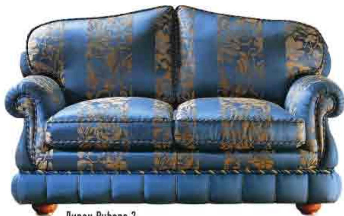
Диван Rubens 2, дерево, шелк, Zanaboni, €8620.

Диван — один из главных предметов в гостиной, и выбрать его нелегко. К счастью, мебельные марки предлагают их великое множество. А если остановиться на одной модели не удалось? Не страшно. Современные интерьерные решения позволяют использовать диваны разного типа — например, модульный и двухместный (вроде широкого кресла).