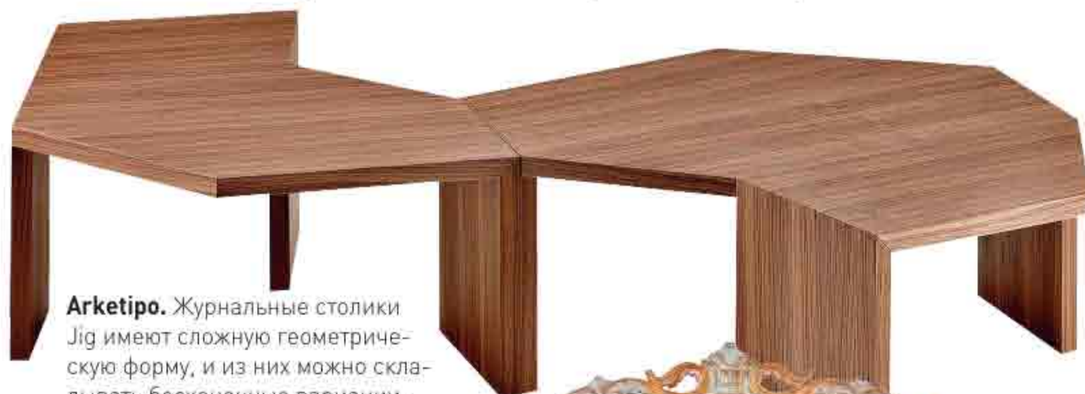
Arketipo. Журнальные столики Jig имеют сложную геометрическую форму, и из них можно складывать бесконечные вариации.

Каждый год в апреле в Милане проходит выставка iSaloni, где дизайнеры и мебельные фабрики представляют новинки. В нашем "отчете" — предметы, на которые стоит обратить внимание.