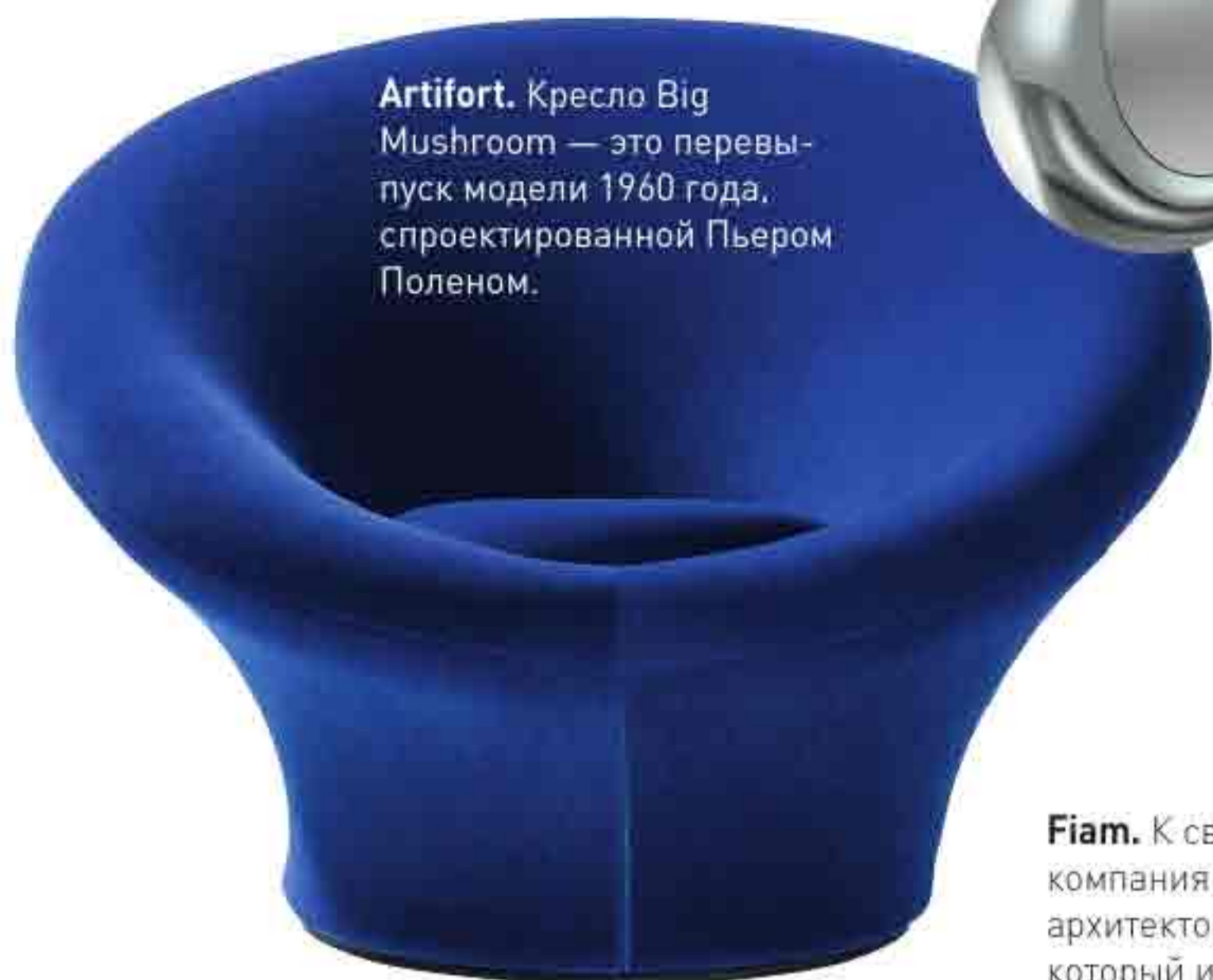
Artifort. Кресло Big Mushroom — это переизпуск модели 1960 года, спроектированной Пьером Поленом.