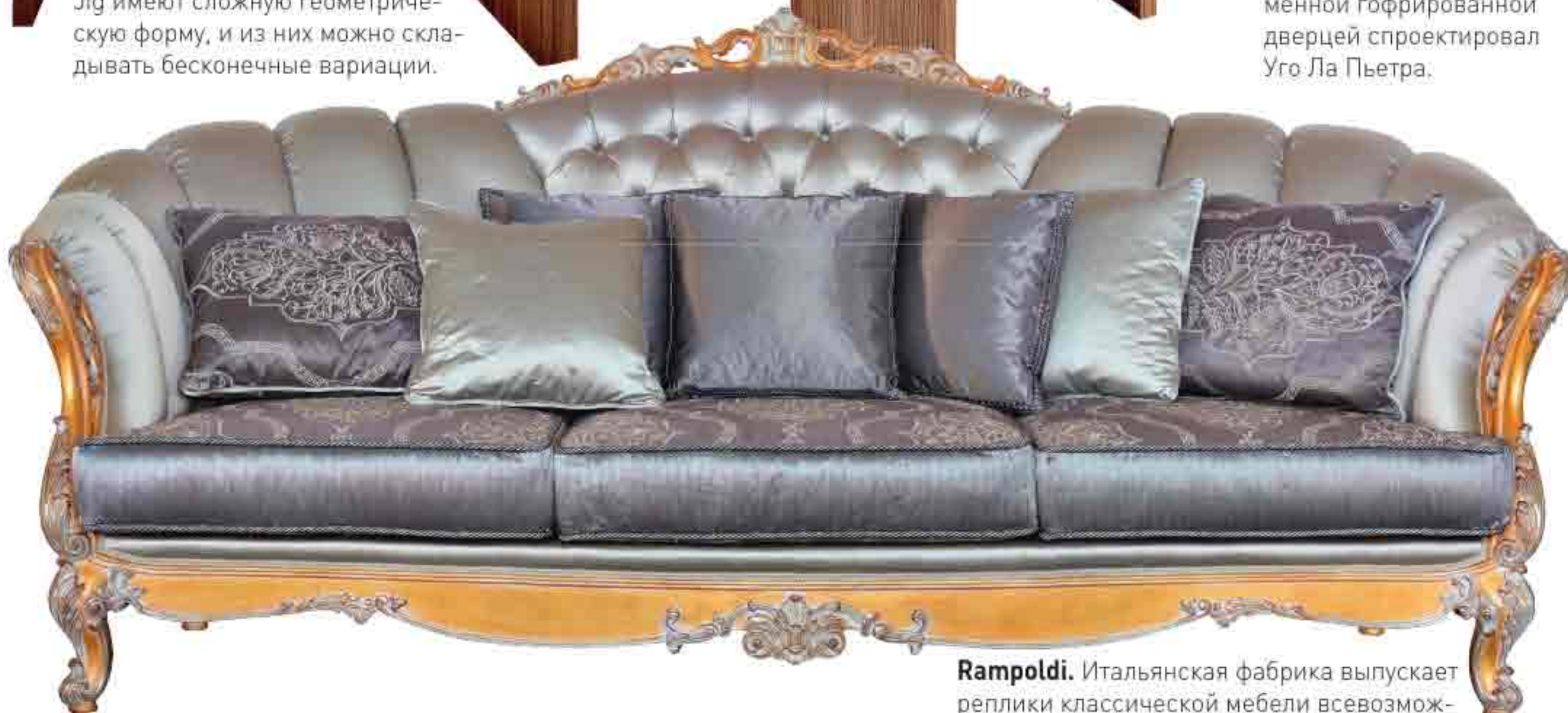
Rampoldi. Итальянская фабрика выпускает реплики классической мебели всевозможных стилей — от барокко до ампира.