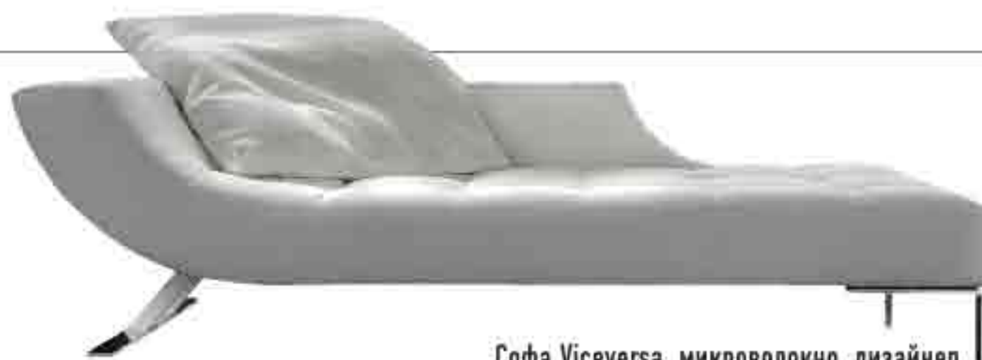
Софа Viceversa, микроволокно, дизайнер Джорджо Соресси, Erba, от €3209.