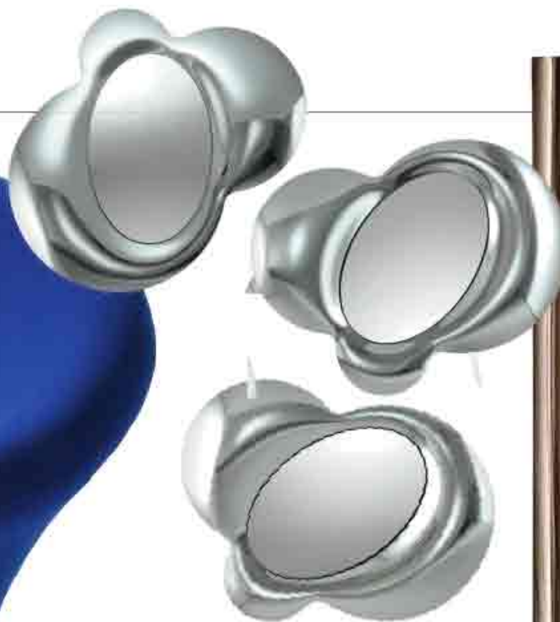
Fiam. К своему сорокалетнему юбилею компания пригласила для сотрудничества архитектора Массимилиано Фуксаса, который и "подарил" ей зеркала Lucy.