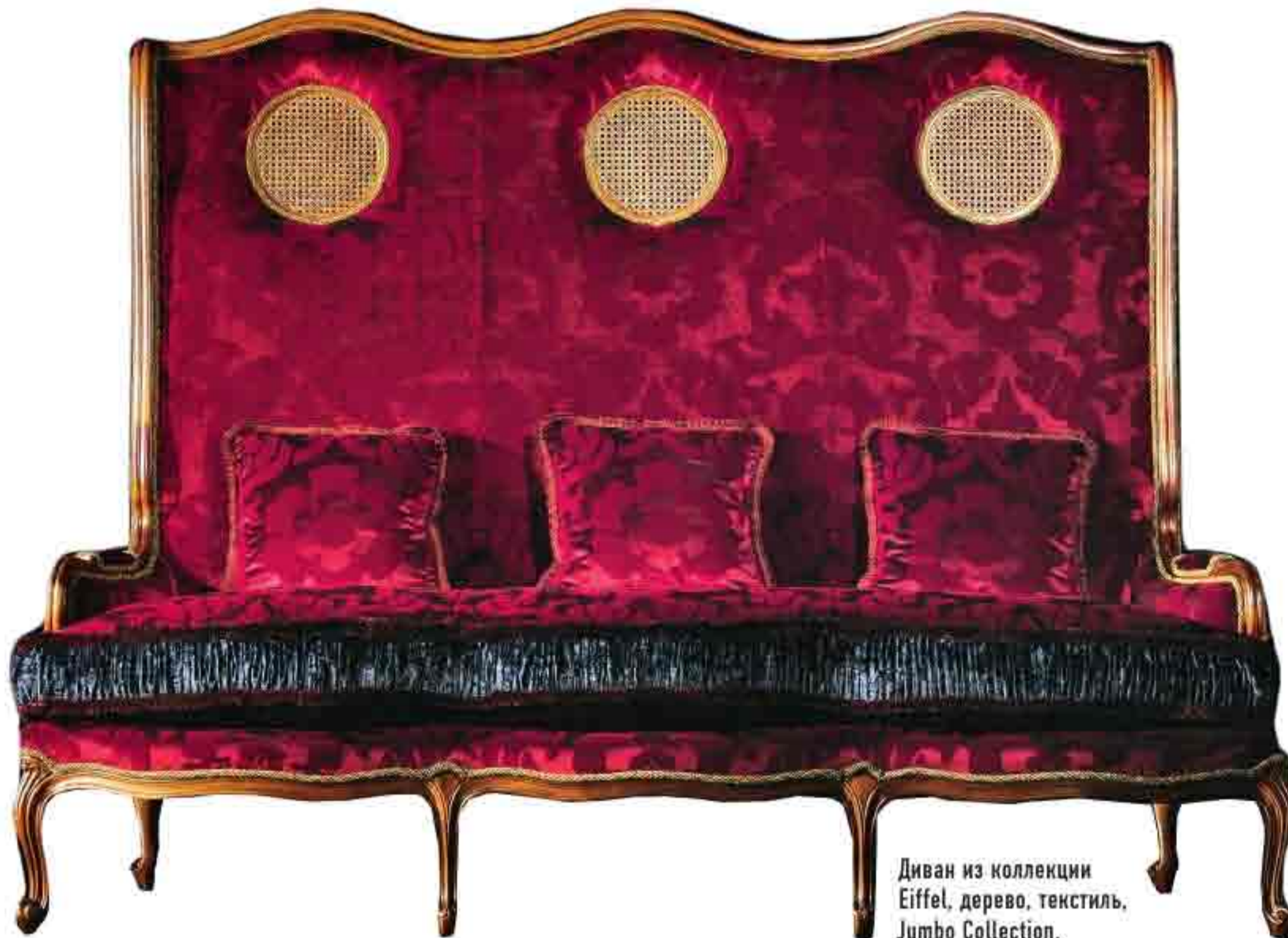
Диван из коллекции Eiffel, дерево, текстиль, Jumbo Collection.