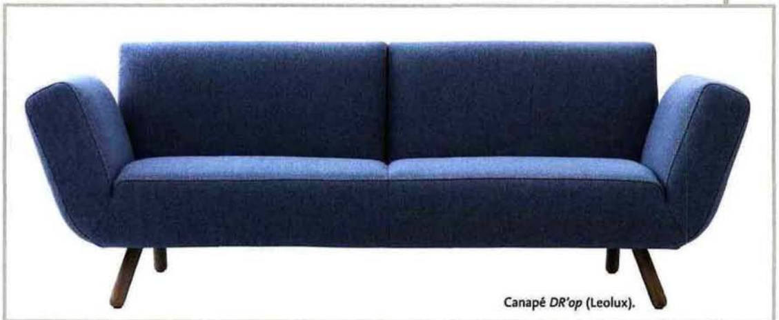
Canapé DR'op (Leolux).