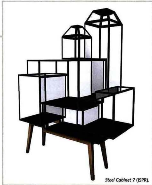
Steel Cabinet 7 (JSPR).