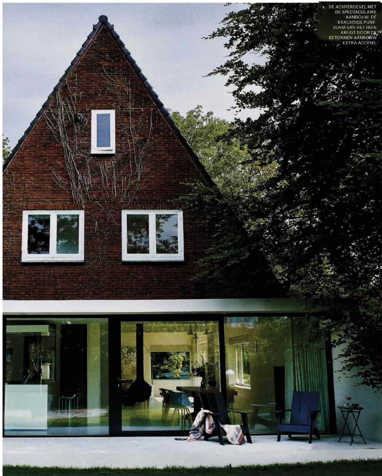
DE ACHTERGEVEL MET DE SPECTACULAIRE AANBOUW. DE KRACHTIGE PUNTVORM VAN HET HUIS KRIJGT DOOR DE BETONNEN AANBOUW EXTRA ACCENT.