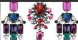
10 orecchini preziosi per festeggiare