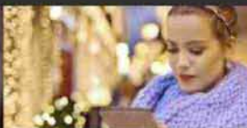
Giro di boa per la corsa ai regali di Natale:...