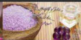
La ricetta dei sali da bagno frizzanti