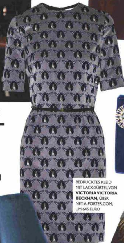
BEDRUCKTES KLEID MIT LACKGÜRTEL VON VICTORIA VICTORIA BECKHAM, ÜBER NET-A-PORTER.COM, UM 645 EURO