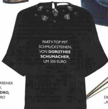
PARTY-TOP MIT SCHMUCKSTEINEN, VON DOROTHEE SCHUMACHER, UM 350 EURO