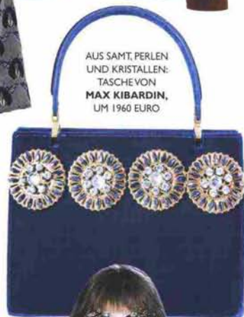
AUS SAMT, PERLEN UND KRISTALLEN: TASCHE VON MAX KIBARDIN, UM 1960 EURO