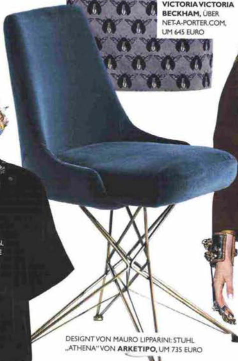
DESIGNT VON MAURO LIPPARINI: STUHL „ATHENA“ VON ARKETIPO, UM 735 EURO