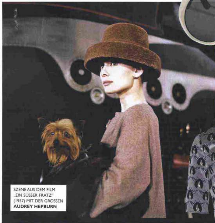
SZENE AUS DEM FILM „EIN SÜSSER FRATZ“ (1957) MIT DER GROSSEN AUDREY HEPBURN