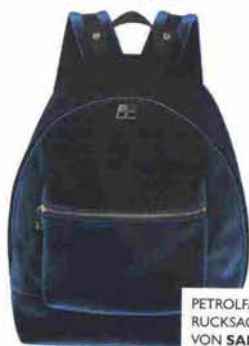
PETROLFARBENER RUCKSACK VON SANDRO, UM 175 EURO