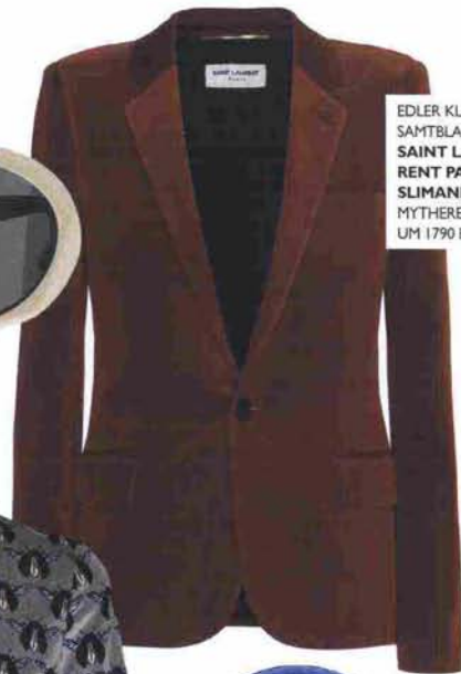
EDLER KLASSIKER: SAMTBLAZER VON SAINT LAURENT PAR HEDI SLIMANE, ÜBER MYTHERESA.COM, UM 1790 EURO