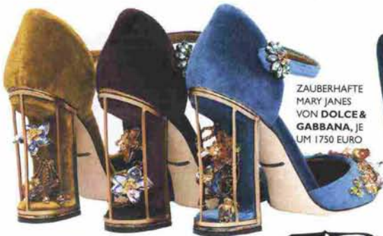
ZAUBERHAFT MARY JANES VON DOLCE & GABBANA, JE UM 1750 EURO

Endlich: Das Kuschelmaterial SAMT feiert ein Revival. Seine Ausstrahlung? Von royal bis casual