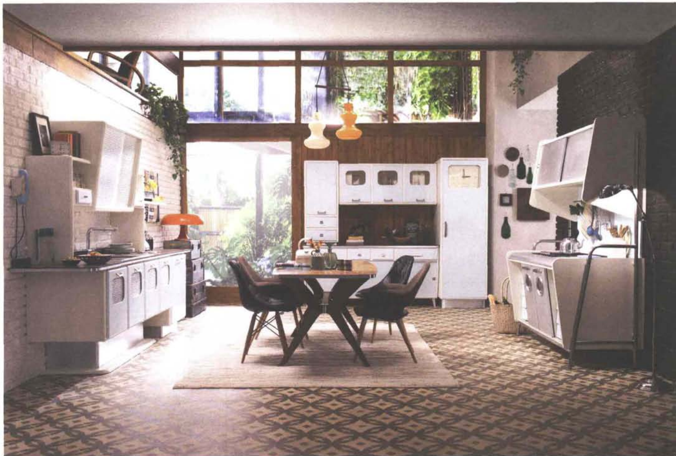
Vintage style e strutture tubolari per il nuovo modello St. Louis di Marchi Cucine.

L a creatività di scena ai Saloni quest'anno punta su praticità, razionalità, semplicità e visualizzazione d'uso. Simbiosi tra forma e funzione, ovvero i fondamentali dell'industrial design che, nato negli anni 50, torna oggi prepotentemente alla ribalta.