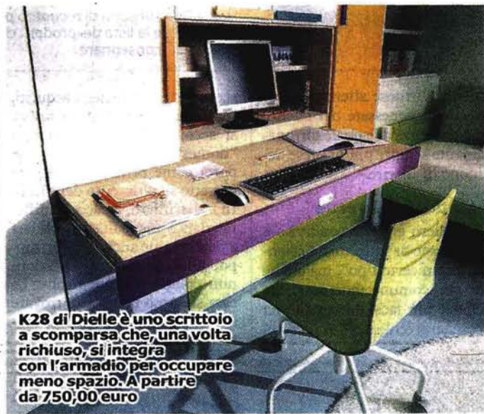
K28 di Dielle è uno scrittoio a scomparsa che, una volta richiuso, si integra con l'armadio per occupare meno spazio. A partire da 750,00 euro

lampade da scrivania dotate di un braccio orientabile e, magari, regolabili in altezza. È bene che la luce non affatichi gli occhi, quindi sono necessari circa 40-60 Watt.