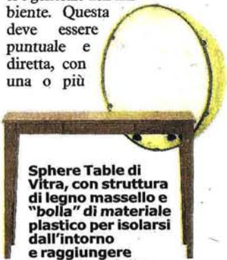
Sphere Table di Vitra, con struttura di legno massello e "bolla" di materiale plastico per isolarsi dall'intorno e raggiungere il massimo della concentrazione. 2.128,00 euro IVA esclusa

È sempre opportuno fornire la zona di un'adeguata illuminazione, che accompagni quella già esistente e generale dell'ambiente. Questa deve essere puntuale e diretta, con una o più