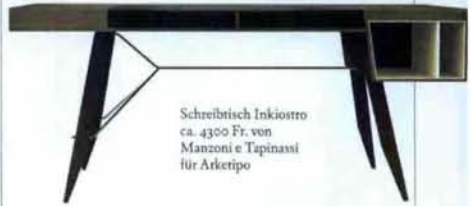
Schreibtisch Inkiostro ca. 4300 Fr. von Manzoni e Tapinassi für Arketipo