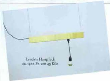
Leuchte Hang Jack ca. 1300 Fr. von 45 Kilo