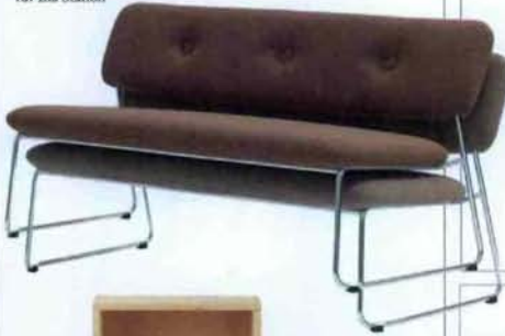
Stapelsofa Dundra S74 ab ca. 1930 Fr. von Stefan Borselius für Blå Station