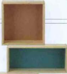
Wandregale Display Boxes je ca. 115 Fr. von Ferm Living