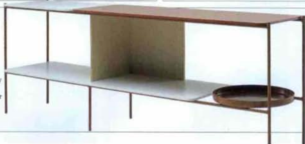
Systemregal Candy ca. 2100 Fr. von Sylvain Willenz für Cappellini