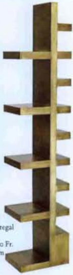
Bücherregal Mass ca. 2900 Fr. von Tom Dixon