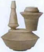
Box Cairn von Constance Guisset für Petite Friture, Preis auf Anfrage