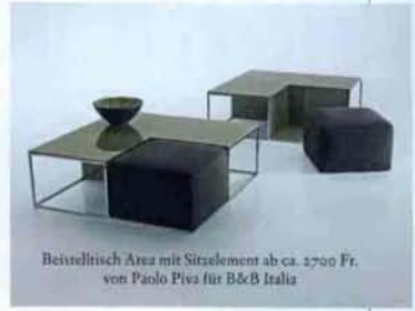
Beistelltisch Area mit Sitzelement ab ca. 2700 Fr. von Paolo Piva für B&B Italia