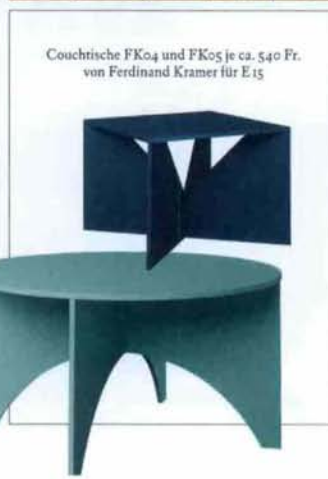
Couchtische FK04 und FK05 je ca. 540 Fr. von Ferdinand Kramer für E15