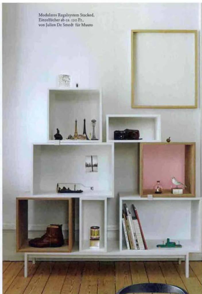
Modulares Regalsystem Stacked, Einzelfächer ab ca. 120 Fr., von Julien De Smedt für Muuto