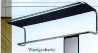
Wandgarderobe S 1520 ca. 380 Fr. von Thonet, mit oder ohne Spiegel ca. 70 Fr.