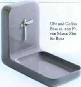
Uhr und Gefäß Posa ca. 200 Fr. von Marco Zito für Boss