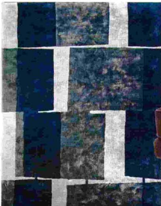
Tapete Time Square, (200x300 cm), de seda vegetal, tecido à mão, €3100, Roche Bobois