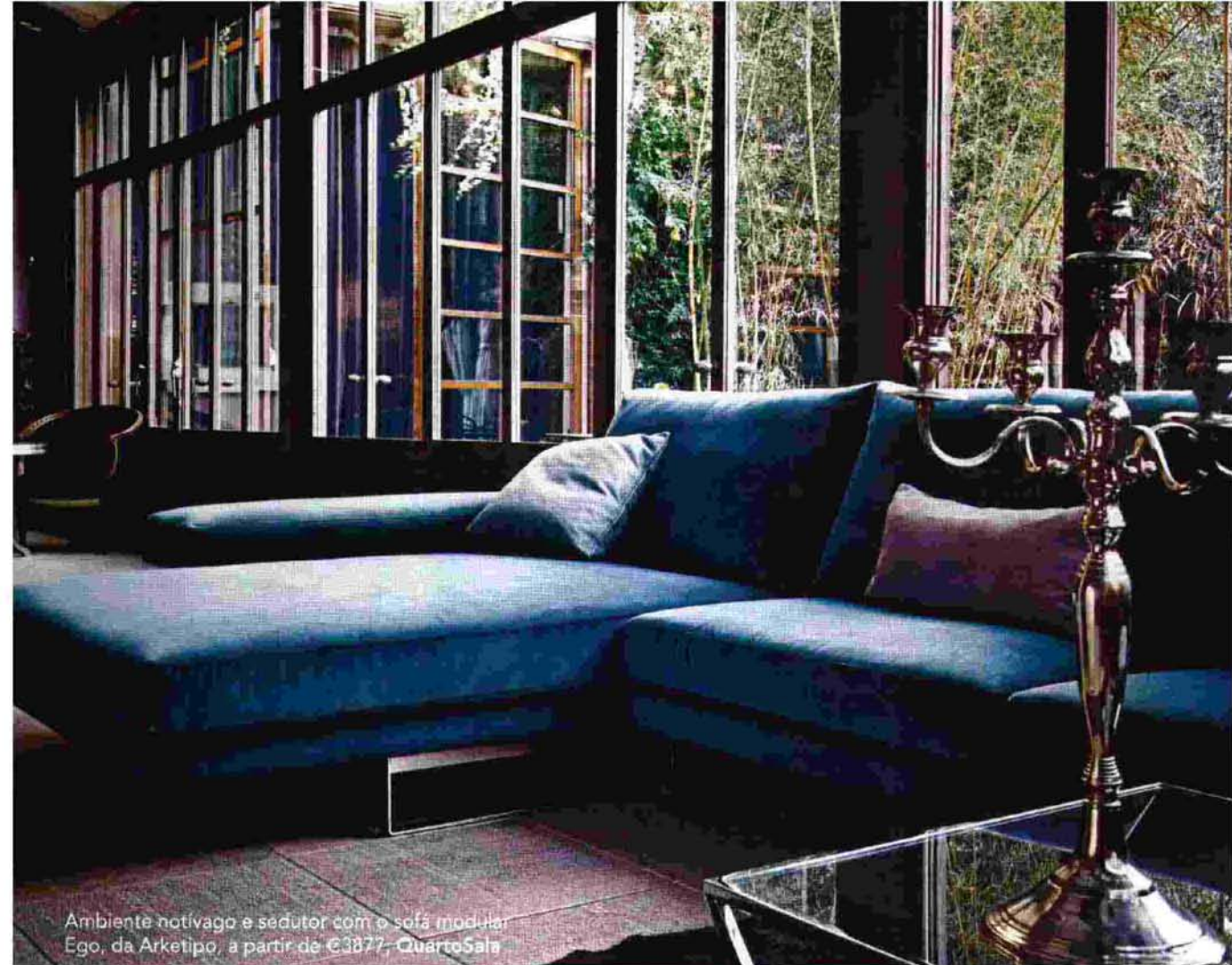
Ambiente notívago e sedutor com o sofá modular Ego, da Arketipo, a partir de €3877, QuartoSala